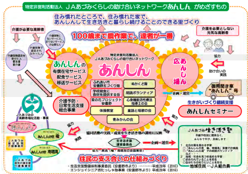
(図1)「あんしん」がめざすもの

第一は、「特定非営利活動法人JAあづみくらしの助け合いネットワークあんしん」(長野県安曇野市)の取組みである。2000年に導