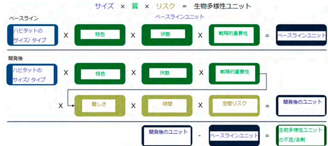
(図表2) 法定生物多様性メトリックによる生物多様性ユニットの算出方法