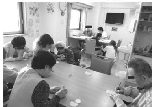
レクリエーション（折り紙で雪だるまを作る）の様子