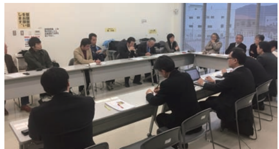
写真1 作物検討会議の様子 (2017年1月、対馬市交流センターにて)