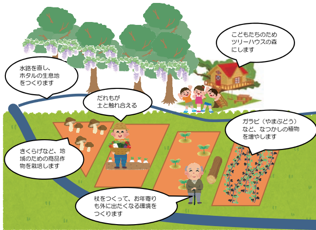
図1 あぐりパーク完成イメージ図