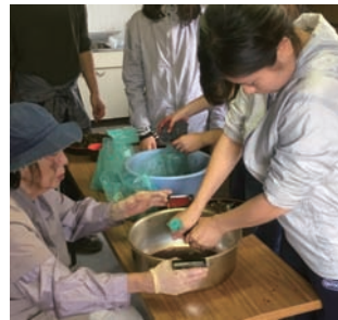
写真3 ガラビの搾汁の様子