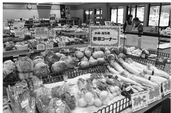
だあすこ沿岸店 売り場