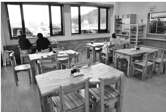
食堂