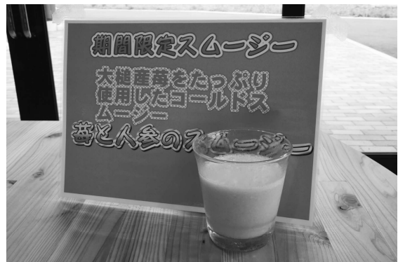
苺と人参のスムージー