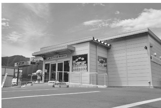
鶴住居支店