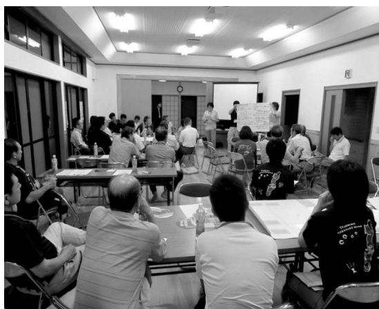
部会における発表風景

11月には、市職員と希望する住民らでオランダとオーストリア（ギュッシング）を訪問し、海洋ゴミ回収技術や木質バイオマスエネ