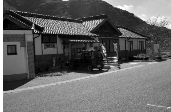
地域の拠点 体験出会い塾「匠」